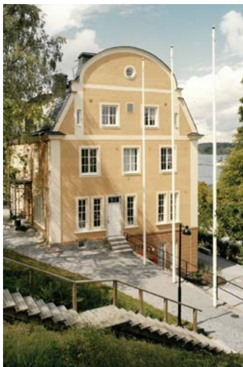
Fabrikörsvillan före branden 2022.

I december 2022 totalförstördes Fabrikörsvillan i en brand och fick mycket omfattande skador. Takkonstruktionen och mellanbjälklag kollapsade och en av skorstenarna rasade i samband med att taket föll in. Fastighetsägaren, Alecta Fastigheter, har efter omfattande utredningar konstaterat att byggnaden inte kan bevaras och har därför lämnat in en ansökan om rivningslov som beviljats av kommunen.