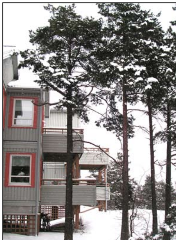
Skogalundshöjdens är ett exempel på ny bebyggelse i värdefull natur. Lovplikt för trädfällning ska bidra till att hållmarkstallskogen bevaras.

Två exempel på områden som är av riksintresse för kulturmiljövården är Norra kusten – farleden in mot Stockholm – och Storängen i centrala Nacka. Ett annat riksintresse är kustområdet och skärgården som omfattar hela