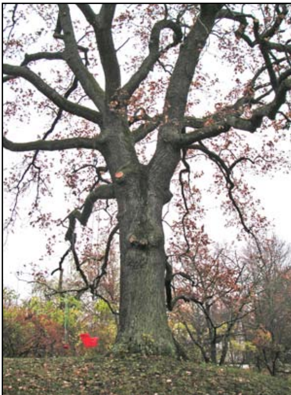
Storängen är av riksintresse för kulturmiljövården. Därför finns högre krav än normalt för hur både byggnader och landskapet får förändras. Många träd, som den här eken, har växt här i århundraden.

Riksintressen och skydd för värdefulla områden Lovplikt för trädfällning sammanfaller till stor