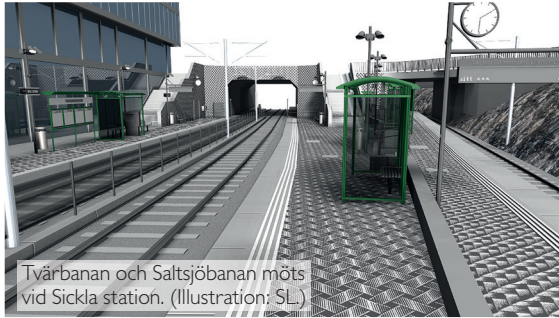
Tvårbanan och Saltsjöbanan möts vid Sickla station. (Illustration: SL)

testas i förhållande till planerna för hur stadsbebyggelsen kan komma att se ut.