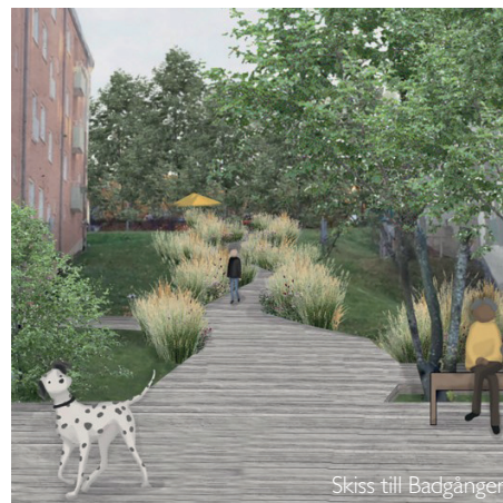
Skiss till Badgången.