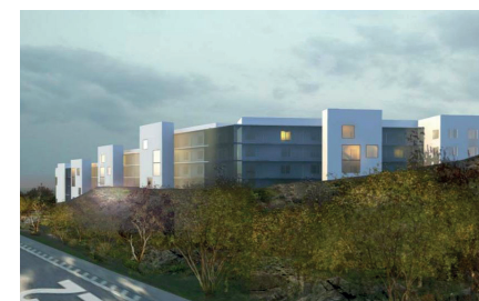
Illustration av Ektorpshuset, från Värmdöleden.

www.nacka.se Studentbostäder i Ektorp LÄS MER