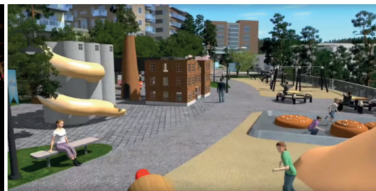
Ljustrålar vid Nya Gatan och modell till lekplats på Kvarnholmen.

för att ta fram konkreta förslag för platserna. Det modellerades, diskuterades, ritades, klipptes, klistrades och jobbades med plastfigurer i samma skala som arkitekter ofta använder.