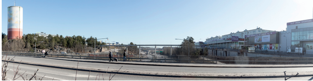
Ovan: Panorama över motorvägsdiktet vid Forum idag. Till höger: tidig skiss till utformning av överdäckning (ur rapport om förstudie).