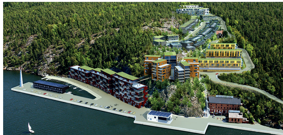
Bild ur gestaltningsprogrammet.