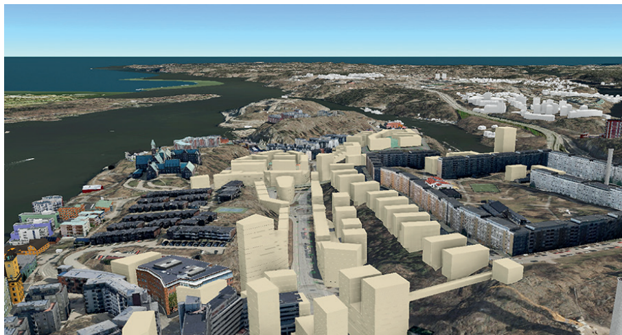
Bild ur 3D-modellen