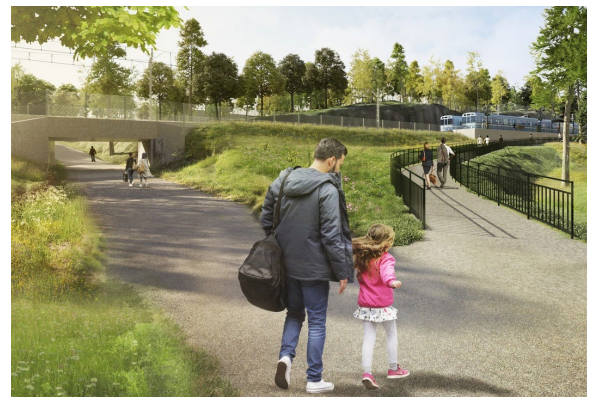
Den nya stationen blir säkrare och mer tillgänglig